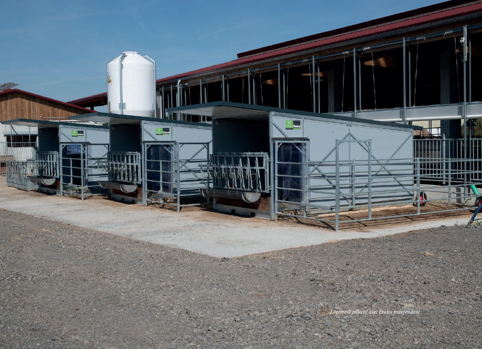
Logement collectif avec Enclos indépendant