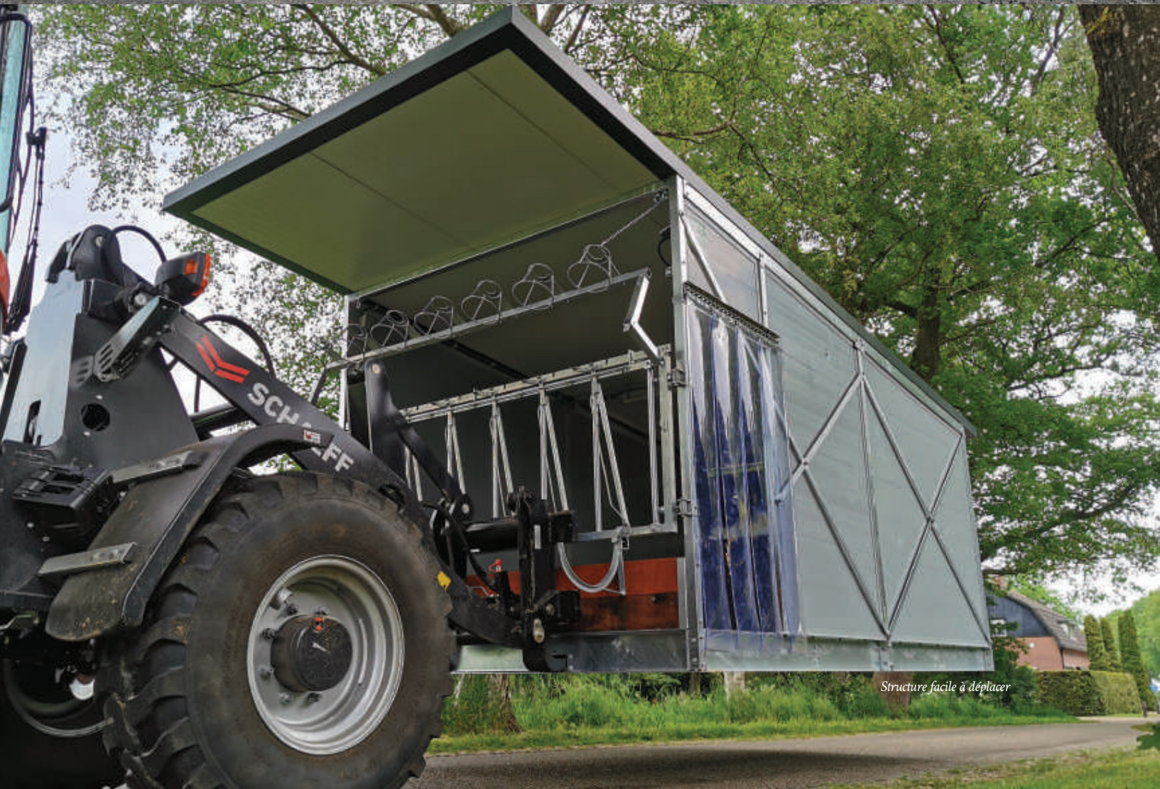
Structure facile à déplacer