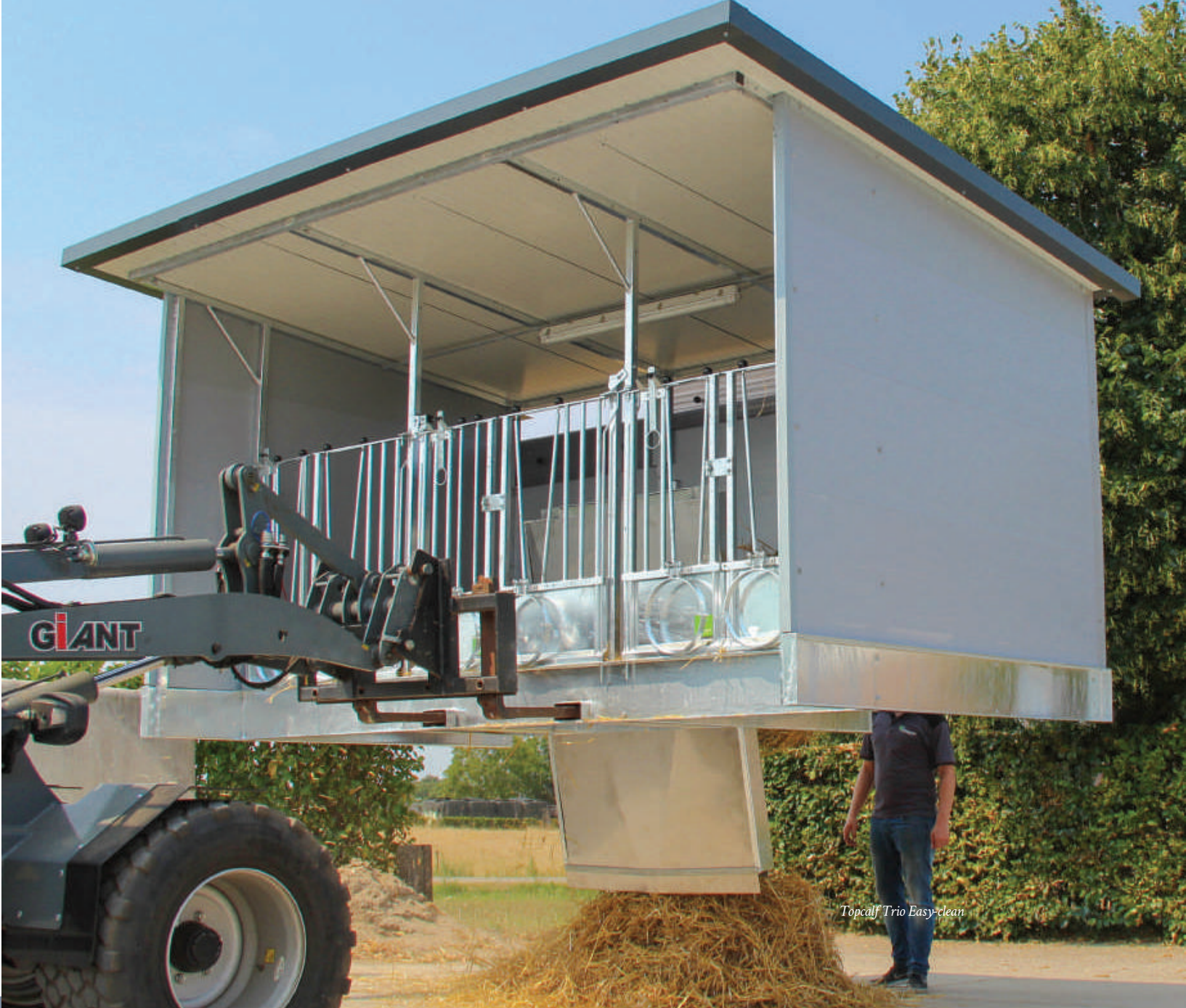
Topcalf Trio Easy-clean