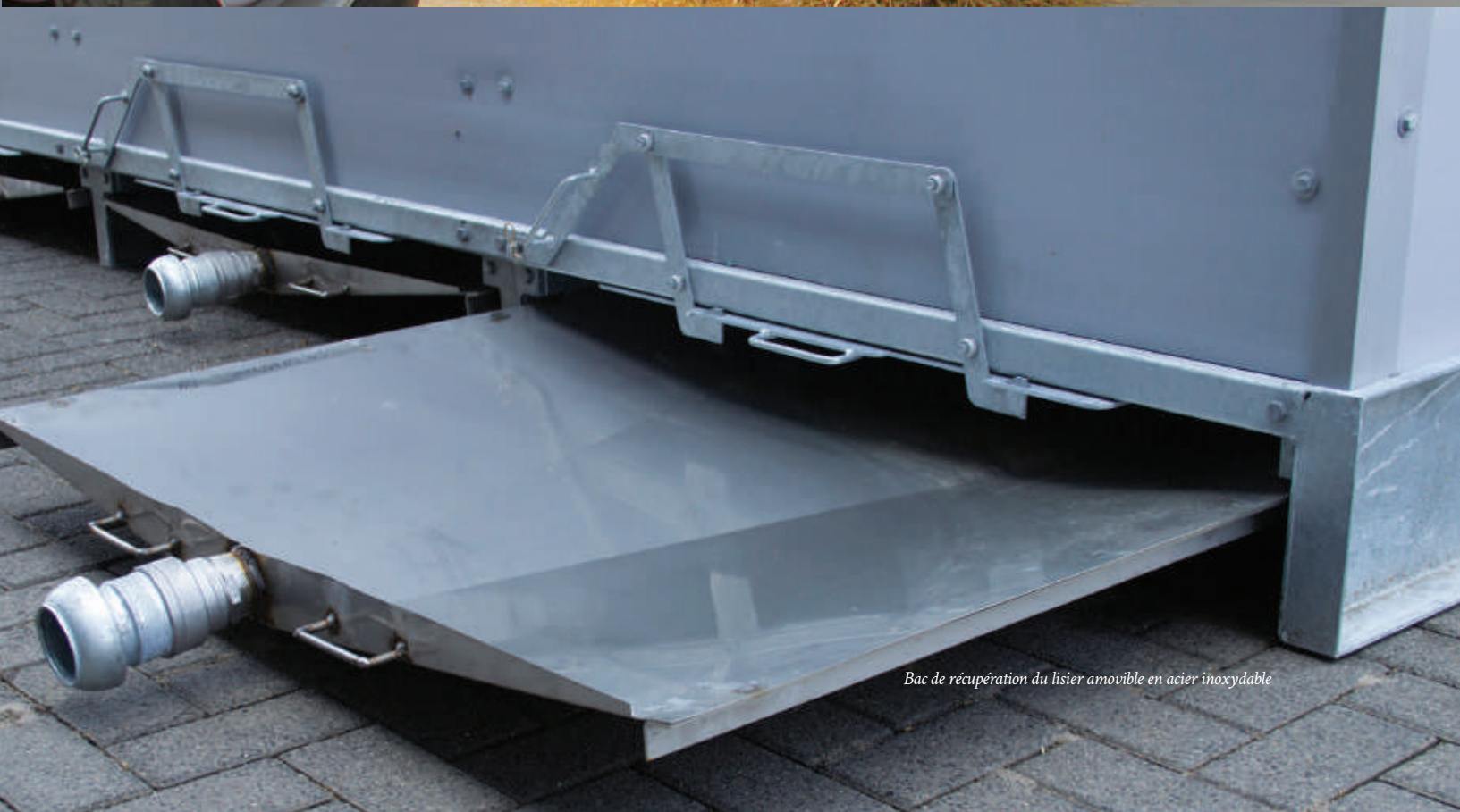
Bac de récupération du lisier amovible en acier inoxydable